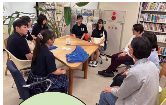
神戸大学・神戸市 フィールドワーク