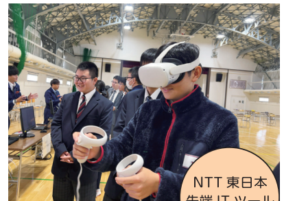
NTT 東日本 先端 IT ツール 体験会