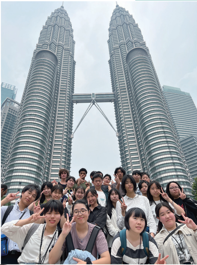
麗澤大学留学生 ニセコ高校 インターンシップ