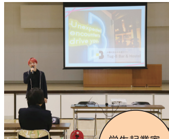
学生起業家による講話

小樽商科大学と連携し、起業家による講話やワークショップ、企業による先端技術体験などのプログラムを実施します。