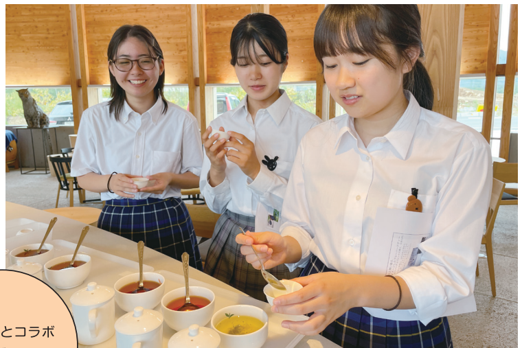
ルピシアとコラボ オリジナル 商品開発

新たな価値やアイデアを生み出して地域課題を解決する取組を、企業や地域の方が支援してくれます。デジタルを活用した新たなサービスの開発や企業とコラボした商品の開発などにチャレンジできます。