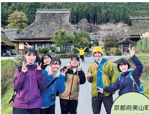
京都府美山町 フィールド ワーク

多くの海外大学の学生や国内大学の留学生が訪れるニセコ町。その強みを活かして外国人学生との国際交流を行います。