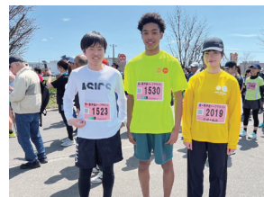
ランニングクラブ